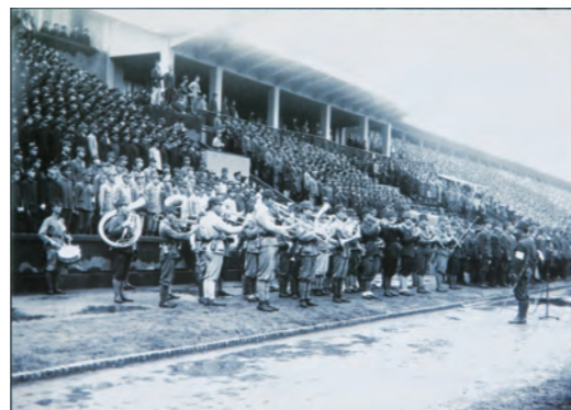
昭和18年出陣学徒壮行会

(1)往復ハガキによる申し込み 往復ハガキに必要な事項をご記入の上、下記までお申し込みください(締切り7月6日(金)必着、返信は7月11日(水)発送予定)。