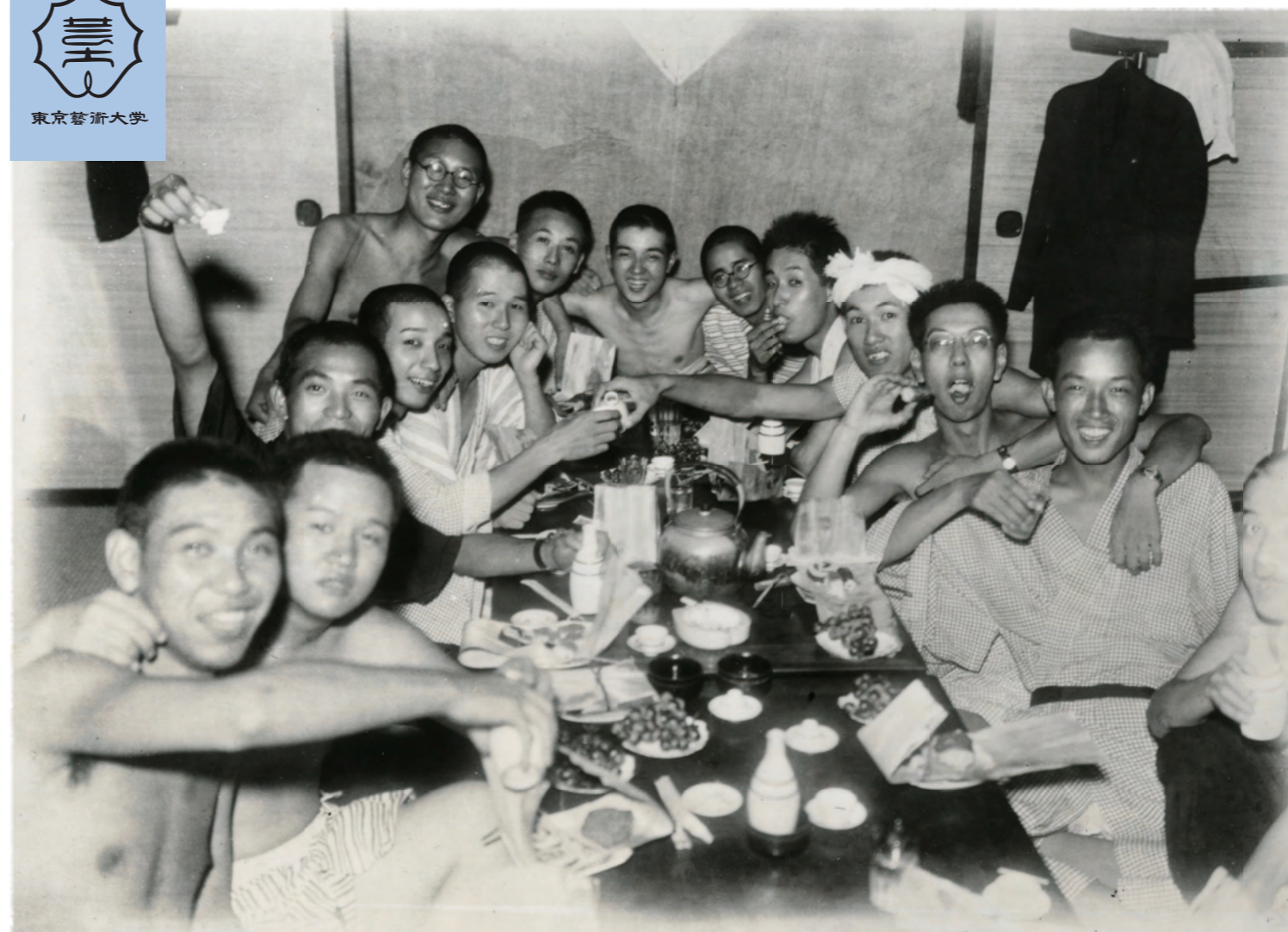
昭和18年9月 演奏旅行先の旅館でくつろぐ東京音楽学校の学生たち